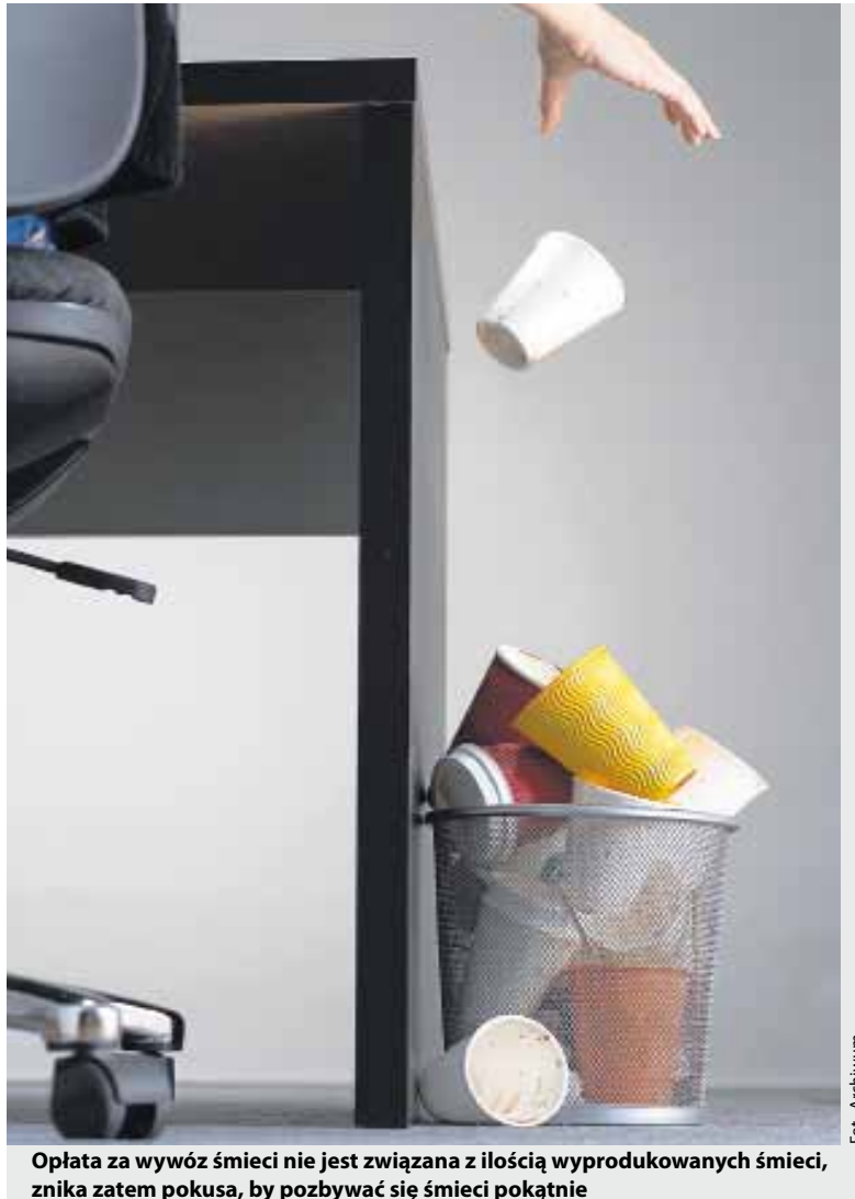
Opłata za wywóz śmieci nie jest związana z ilością wyprodukowanych śmieci, znika zatem pokusa, by pozbywać się śmieci pokątnie

Opłata za gospodarowanie odpadami komunalnymi wnoszona będzie przez właścicieli nieruchomości na rachunek bankowy Gminy Łysomice bez wezwania, kwartalnie w terminie do ostatniego dnia pierwszego miesiąca kwartału, którego obowiązek ponoszenia opłaty dotyczy.