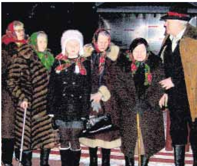
Gościnnie kolędowanie wykonywały Seniorki z Parafii Grzywna

Kustosz Izby Historii i Tradycji w Łysomicach)