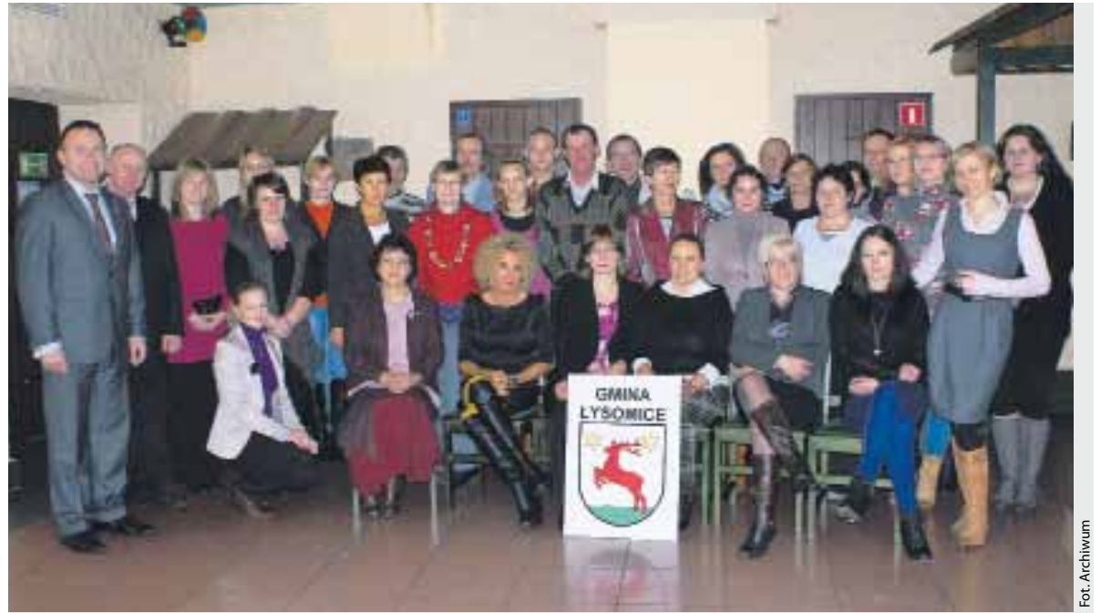
Uczestnicy konferencji podsumowującej Projekt „Lepsze Jutro”