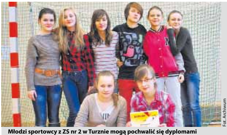
Młodzi sportowcy z ZS nr 2 w Turznie mogą pochwalić się dyplomami