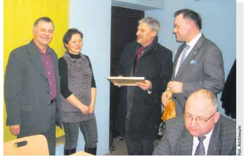
13 marca odbyło się w Centrum Animacji Kultury w Łysomicach uroczyste zebranie stowarzyszenia

Obecnie Stowarzyszenie Rozwoju Gminy Łysomice ma złożone 6